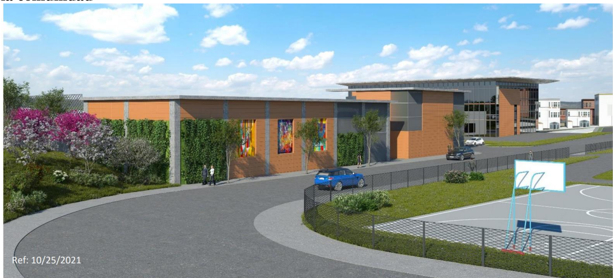
Imagen 2: Diseño de fachada de subestación potencial propuesto para las aportaciones de la comunidad

Nota: Este es solo un concepto de diseño. El diseño final se elegirá en colaboración con la comunidad y puede variar.