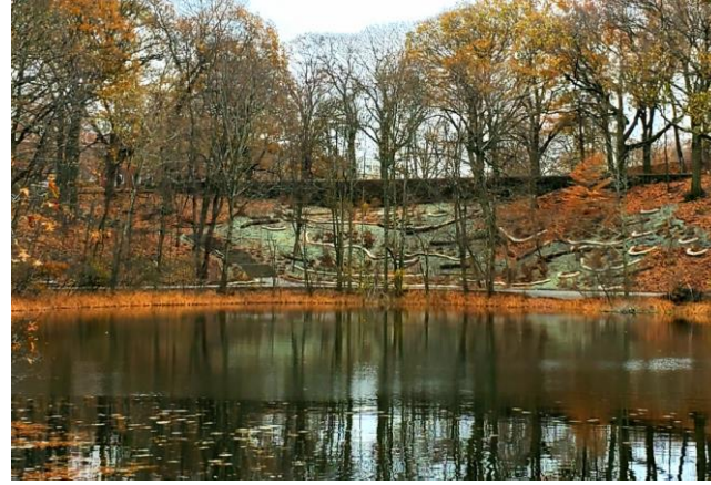
واجهة البحيرات وزراعة الأشجار