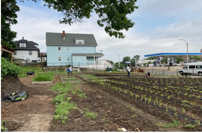
الحدائق المجتمعية والمزارع الحضرية