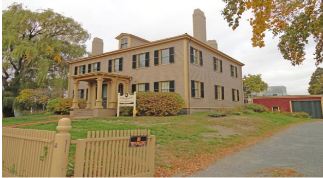
الوثائق أو التحف