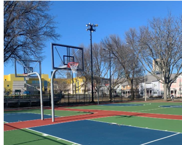
ملاعب كرة السلة والملاعب الرياضية