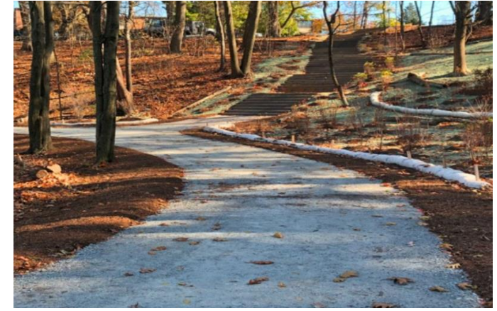
الحفاظ على الأراضي والدروب